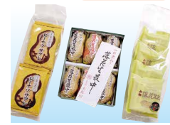
「落花生もなか」ほか