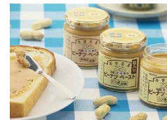
「ピーナツペースト」