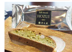
抹茶ビスコッティ「HOZUI-宝瑞-」