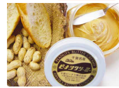
「ピーナツクリーマー」