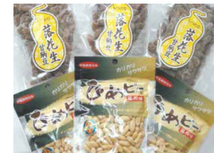
「落花生甘納豆」「ひめピー」