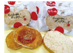
「らっかせいダックワーズ」