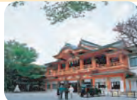
千葉神社 詳しくは29ページへ→