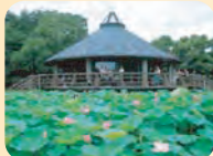
千葉公園 詳しくは25ページへ→