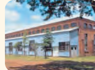
鉄道第一聯隊材料廠跡