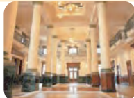
市美術館 詳しくは28ページへ→