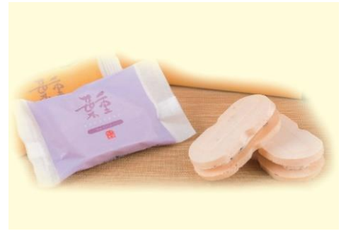
No.3 葉重(ブルーベリー味入り) (株)川島屋・マロンド