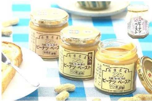
No.4 元祖ピーナツペースト (パン用加糖粒入り) (有)清本園