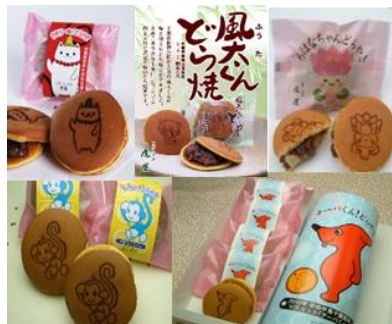
No.8 千葉 ゆるきやら だらやき (有)虎屋