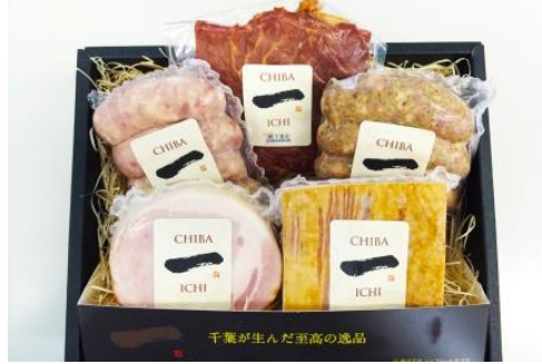
No.5 千葉県産「一」シリーズ 【ハム・ベーコン・ソーセージ】 (株)シェフミートテグサ