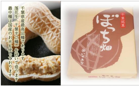
No.1 千葉銘菓ぼっち畑 (株)菓子庵いずみ野