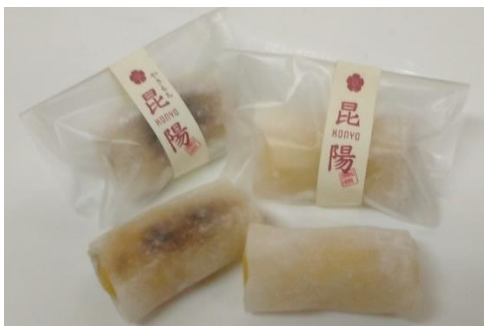
No.10 昆陽セット (パティスリータルブ)