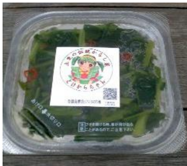
No.7 とけからちゃんからし菜 (千代田漬物株)