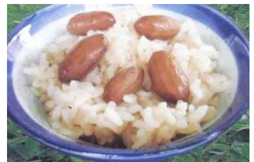
No.9 落花生ごはんの素 (株)はせべ・豆処はせべ