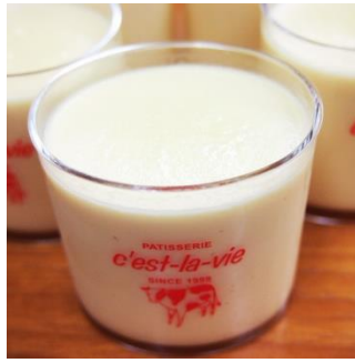
No.2 和三盆プリン (有)菓子工房セラヴィ