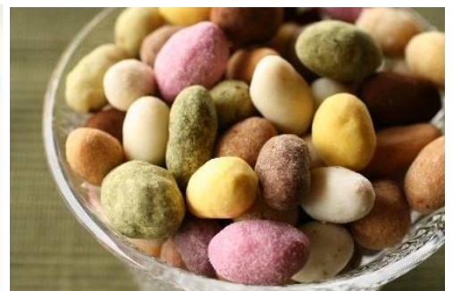
No.12 Enjoy Peanuts (株)やます

表面に必要事項を記入のうえ、そごう千葉店、千葉三越に設置の投票箱に投票してください。 10月8日(土)、9日(日) 10:00～