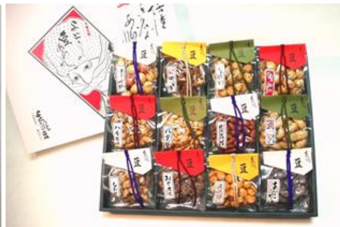
No.11 与三郎の豆じまん (有)福井商店・与三郎の豆