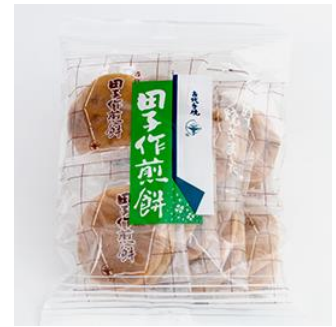
No.6 田子作煎餅 (有)田子作本舗本店