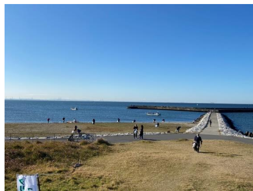
（検見川の浜 観光地美化キャンペーン）

■協 力：磯辺地区地域運営委員会、33地区町内自治会連絡協議会、ザ・サーフ オーシャンテラス