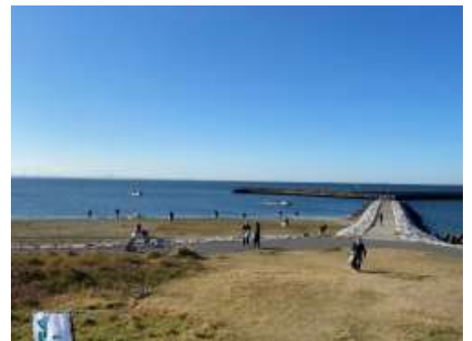
（検見川の浜 観光地美化キャンペーン）

■協 力：磯辺地区地域運営委員会、33地区町内自治会連絡協議会、ザ・サーフ オーシャンテラス<予定>